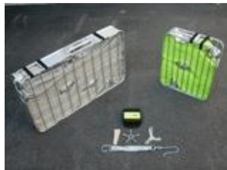
Abbildung 1 - Schlauchtragekorb