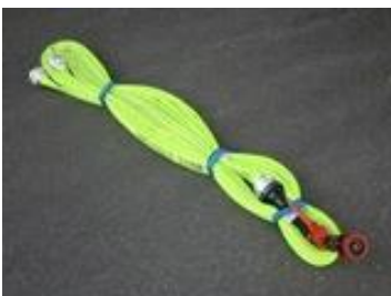
Abbildung 3 - Schlauchpaket