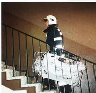
Abbildung 2 - Schlauchtragekorb

Bei Verwendung von C-Schlauchtragekörben oder Schlauchpaketen rüstet sich der ATRM mit dem Schlauchtragekorb und der ATRF mit dem Schlauchpaket mit angekuppeltem Strahlrohr aus. Auf Kommando kuppelt der Truppmann den Druckschlauch am Verteiler an legt mit dem Tragekorb die Löschleitung aus. Am Ausgangspunkt für den Angriff wird das Schlauchpaket angekuppelt und aufgelegt. Der Trupfführer gibt das Kommando „... - Wasser marsch!“ entsprechend der Gruppe und dem Rohr.